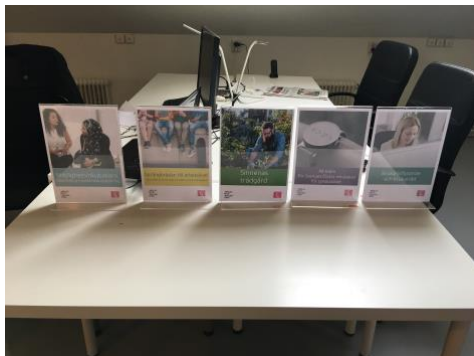
Nya projekt på gång!