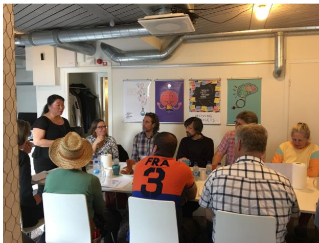
Idépitchningar med Allmänna Arvsfonden