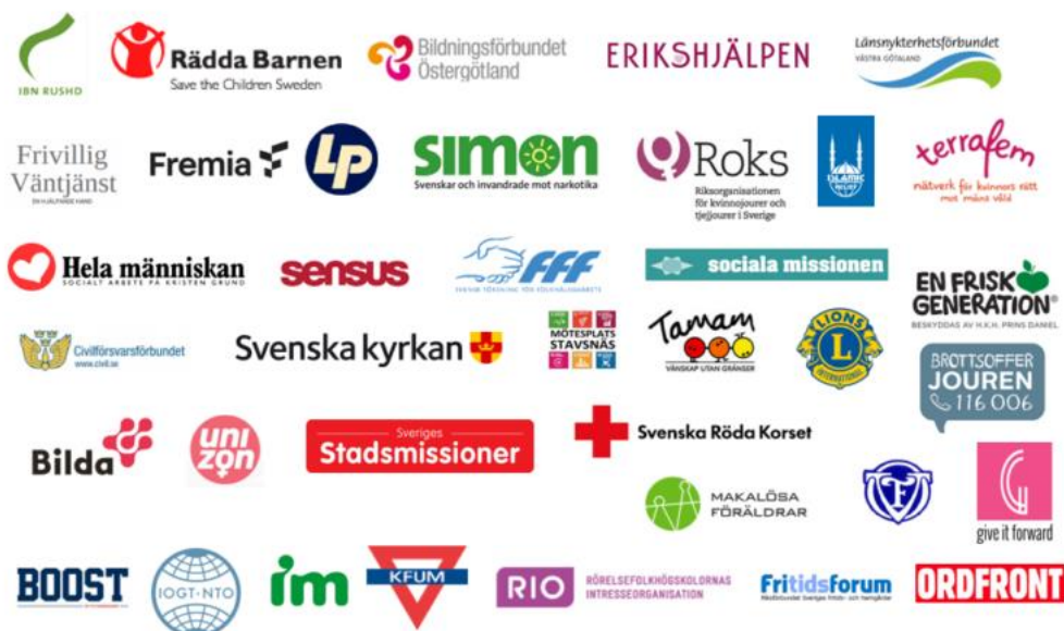
Bild: Riksorganisationen medlemmar i FORUM paraplyorganisationen för idéburna organisationer med social inriktning

Arbetsmarknaden står inför de största utmaningarna under överskådlig tid. Samtidigt pågår omläggningen av arbetsmarknadspolitiken och reformeringen av Arbetsförmedlingen. Riksorganisationen har genom sin röst i FORUM – paraplyorganisationen för idéburna organisationer med social inriktning påverkat för att det behövs en förtydligad roll för civila samhället i omläggningen av arbetsmarknadspolitiken. Samhällets gemensamma kraft behöver läggas på ett fungerande arbete för arbetslösa och arbetsgivare i hela landet. För det behövs besked från regeringen om hur rollfördelningen ska se ut, anser riksorganisationen Give it forward.