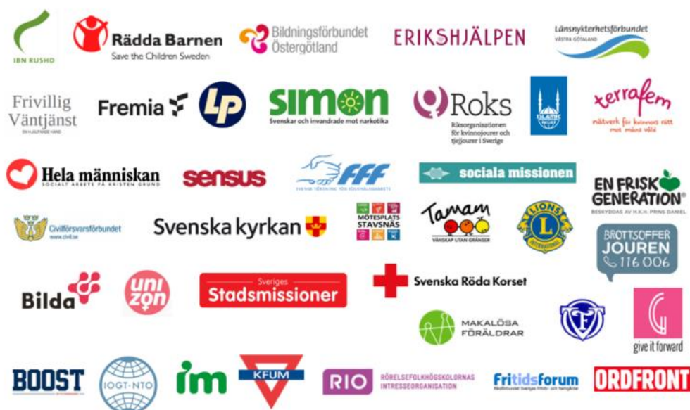
Bild: Riksorganisationen medlemmar i FORUM paraplyorganisationen för idéburna organisationer med social inriktning

Arbetsmarknaden står inför de största utmaningarna under överskådlig tid. Samtidigt pågår omläggningen av arbetsmarknadspolitiken och reformeringen av Arbetsförmedlingen. Riksorganisationen har genom sin röst i FORUM – paraplyorganisationen för idéburna organisationer med social inriktning påverkat för att det behövs en förtydligad roll för civila samhället i omläggningen av arbetsmarknadspolitiken. Samhällets gemensamma kraft behöver läggas på ett fungerande arbete för arbetslösa och arbetsgivare i hela landet. För det behövs besked från regeringen om hur rollfördelningen ska se ut, anser riksorganisationen Give it forward.